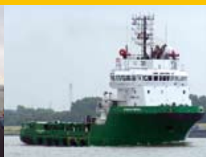
Navigation en mer